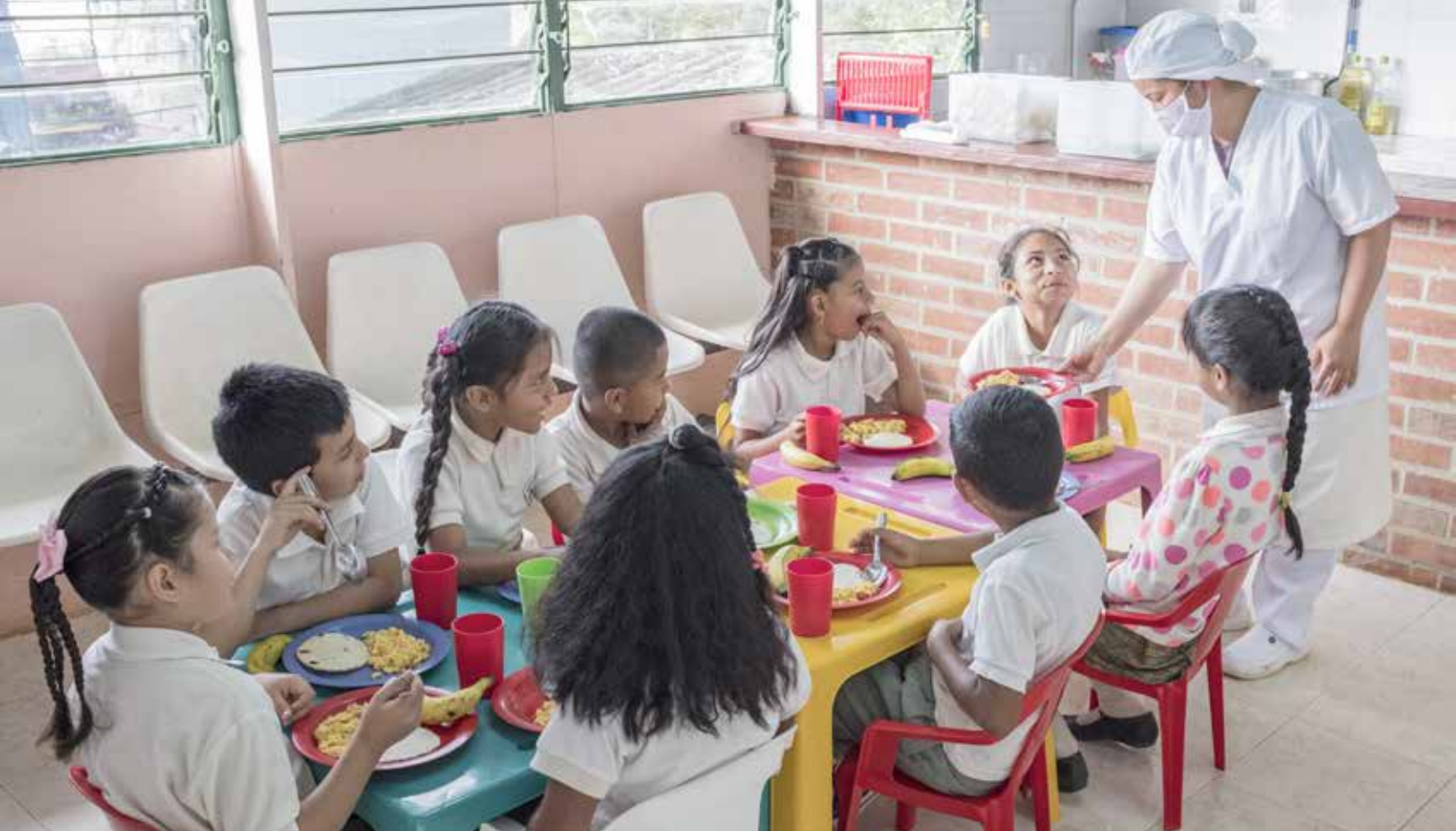
Comedor infantil intervenido con el programa de promoción de estilos de vida saludable en Valle del Cauca, Colombia.