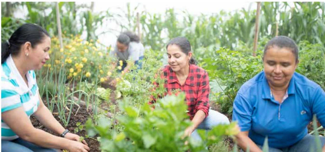
Proyecto Germinar en Ciudad Bolívar, Antioquia, Colombia.