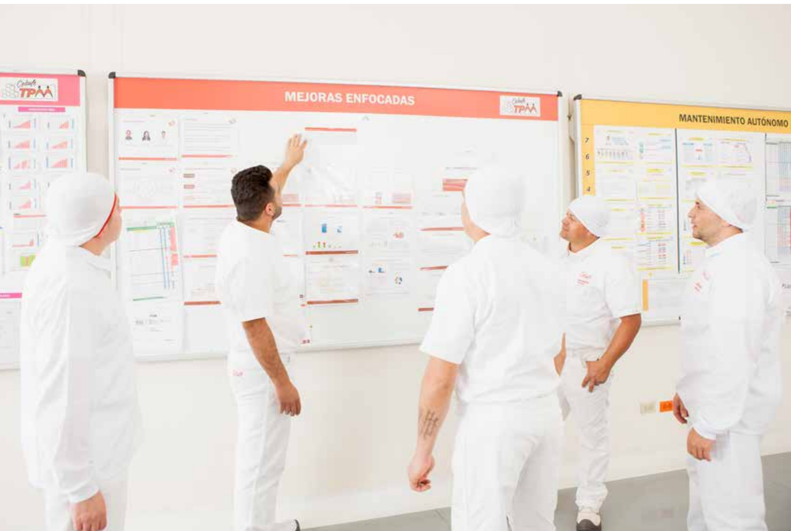
Proceso de mejoras enfocadas en la planta del Negocio Cafés en Bogotá, Colombia.