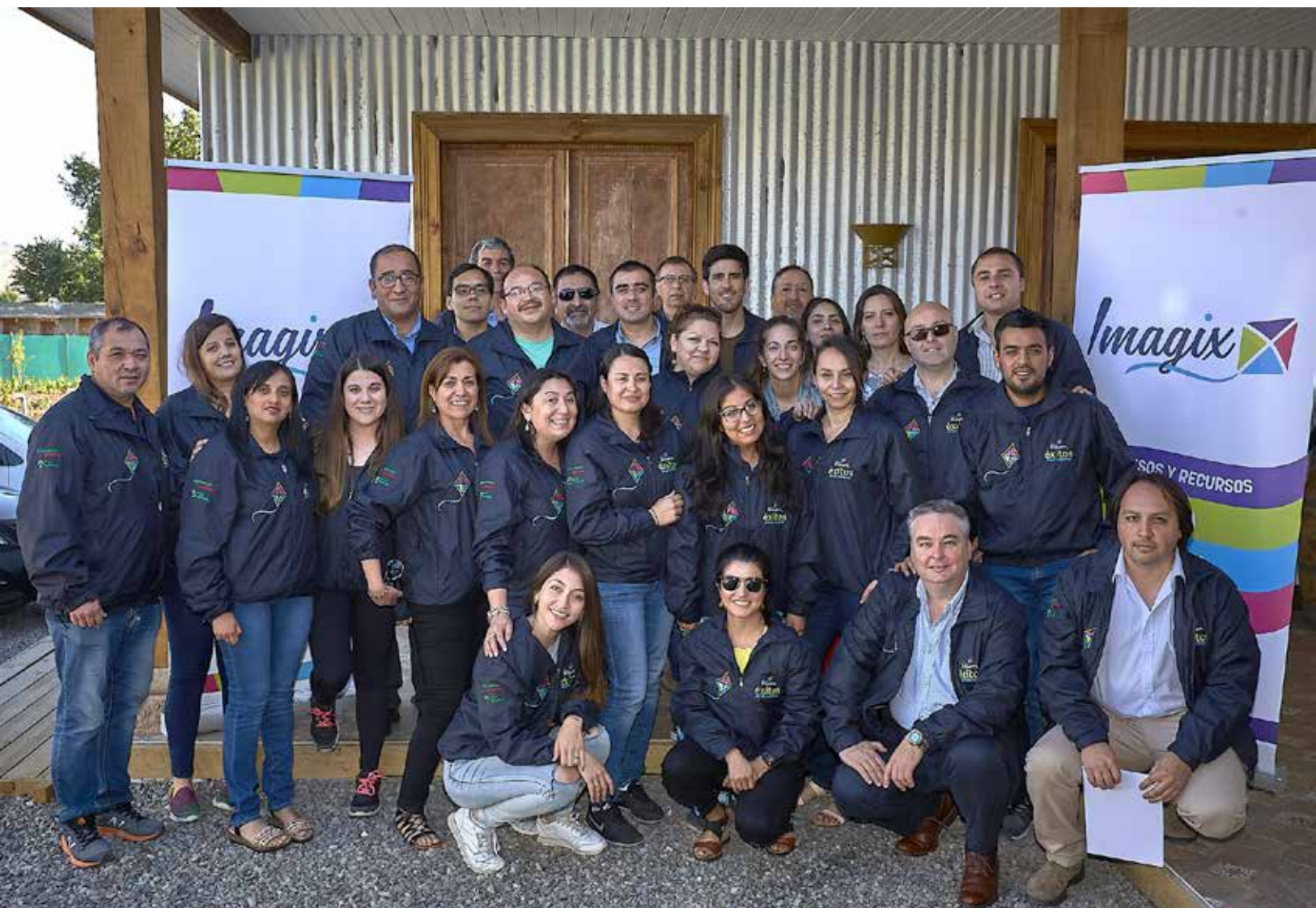
Promotores de innovación del Negocio Tresmontes Lucchetti, Chile.